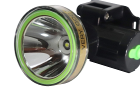
Model - 522 Chế độ cảnh báo