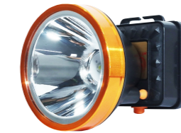
Model - 339