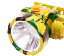
Model - 203