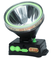
Model - 723