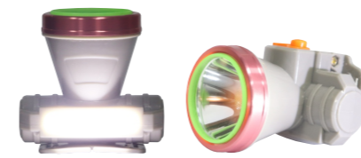
Model - 328 Chế độ đèn ngủ