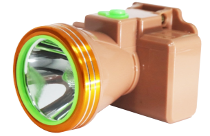
Model - 628 Chế độ cảnh báo